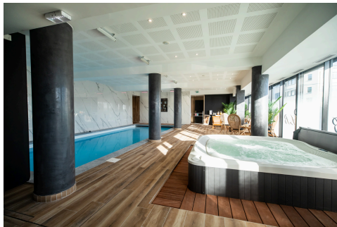
Espace bien être