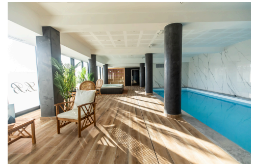
Espace bien être

Découvrez notre hôtel **** et ses 90 chambres tout confort, réparties sur 4 étages, pensées pour répondre à toutes les envies.